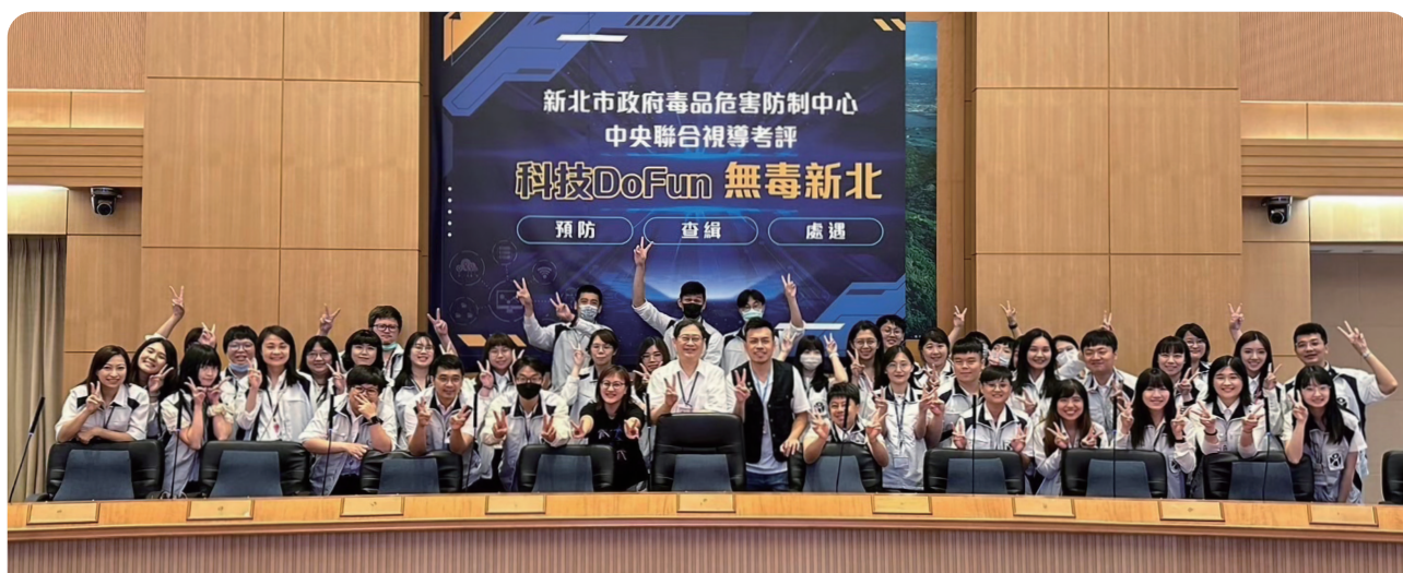
新北市毒品危害防制中心重視人才培育，內建「師徒」陪伴制度，於去（2024）年聯合視導獲得特優。